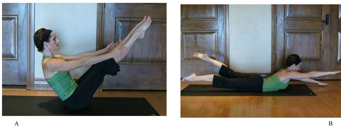
Slika 2. Pilates vježbe; A - vježba "teaser", B - vježba "plivanje" Dostupno na: https://www.ncbi.nlm.nih.gov/pmc/articles/PMC2684152/figure/Fig4/ (29.8.2019.)