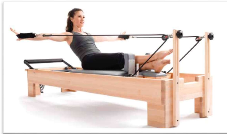
Slika 1. Reformer